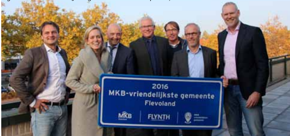
Leden MKB en BAN feliciteren gemeente Noordoostpolder met titel ‘MKB-vriendelijkste gemeente Flevoland’.